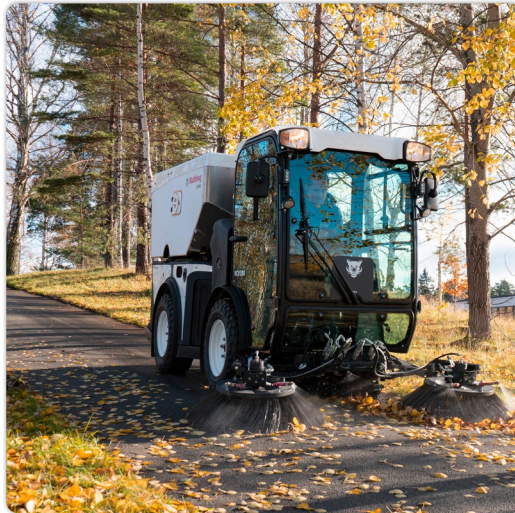
CV - Aspirateur balai