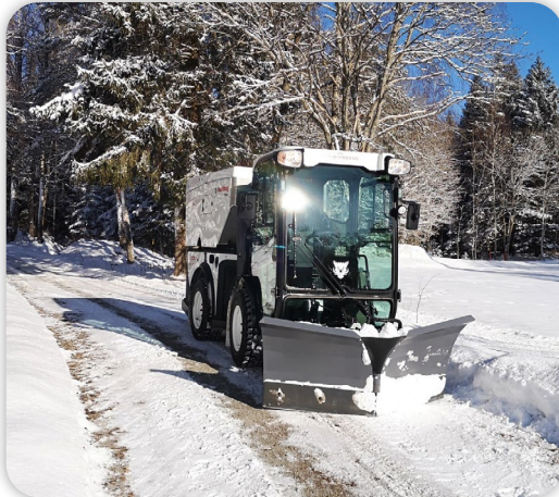
Chasse-neige en V pliante