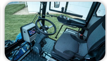
CV - Cabine