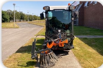
Brosse à mauvaises herbes