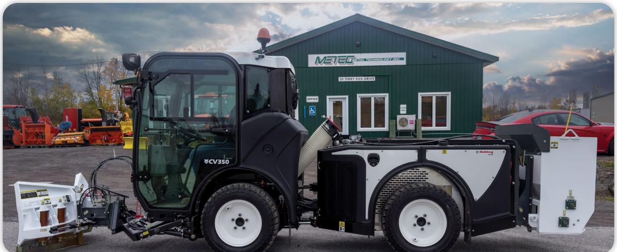
Chasse-neige en V pliante et Epandeuse à sel/sable