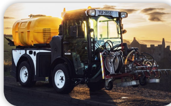
Balayeuse de voirie